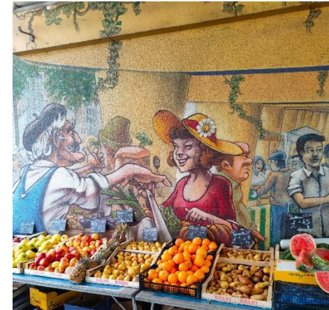
Le marché de l'Estacade