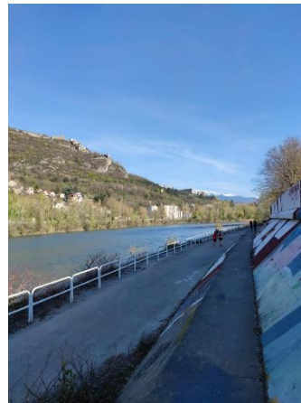
Footing le long de l'Isère