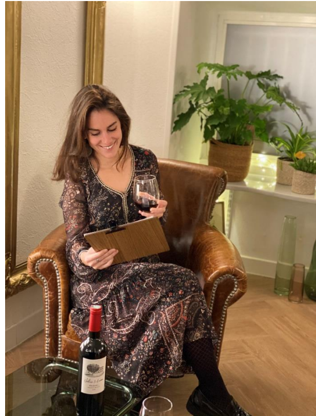
Apéritif du 1924 Hôtel