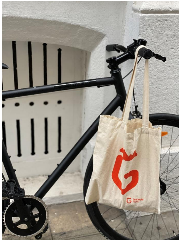
Se promener en vélo